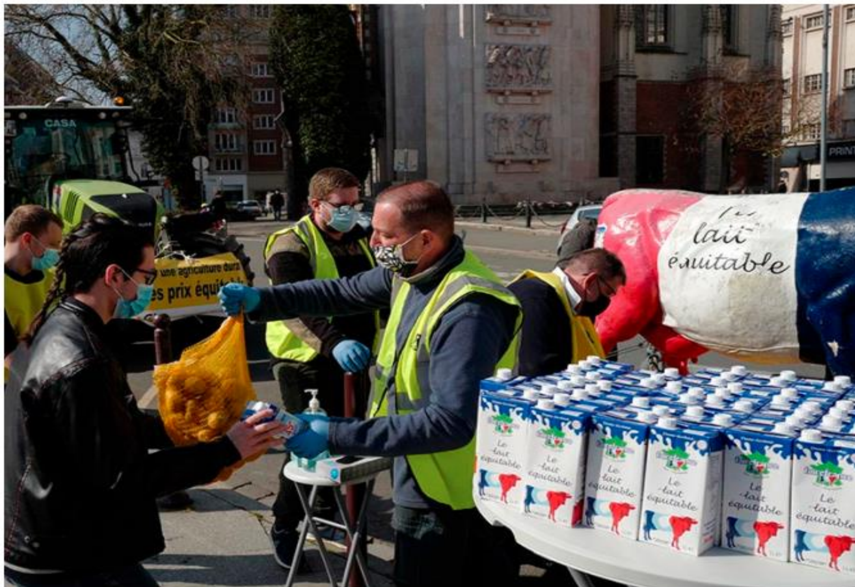
Hunger i Frankrike på grund av pandemin. Bönder delar ut mat i staden Lille i mars 2021.

Pandemin skjuter ner de globala utvecklingsmålen (ui.se)